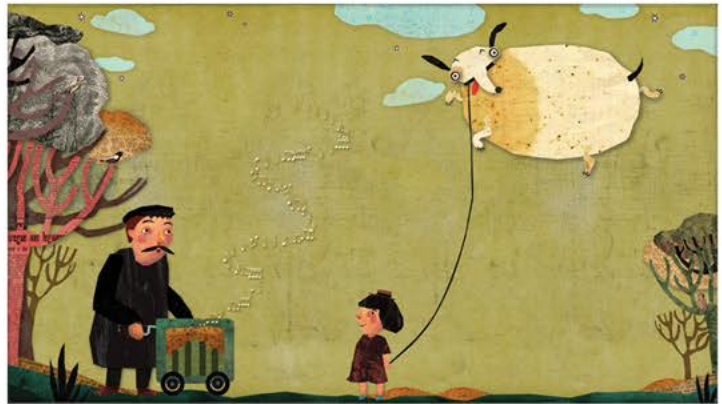
„Was ist denn hier passiert“, Tulipan Verlag, 2015